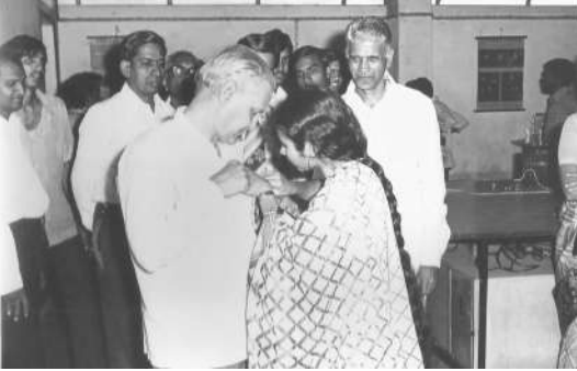
वार्षिक स्नेहसंमेलन प्रसंगी प्रमुख पाहुणे प्रा. भालबा केळकर (१९७८-७९)