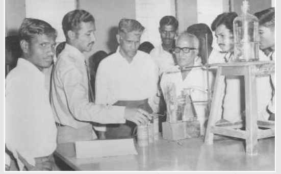
विज्ञान वाणिज्य कला प्रदर्शनात प्रात्याक्षिकाचे निरिक्षण करताना