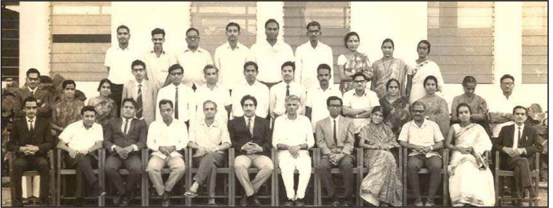
अध्यापक वर्ग १९७१-७२