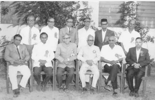
संचालक समिती विद्या प्रसारक मंडळ व प्रमुख पाहुणे एस. एम. जोशी (१९७२-७३)